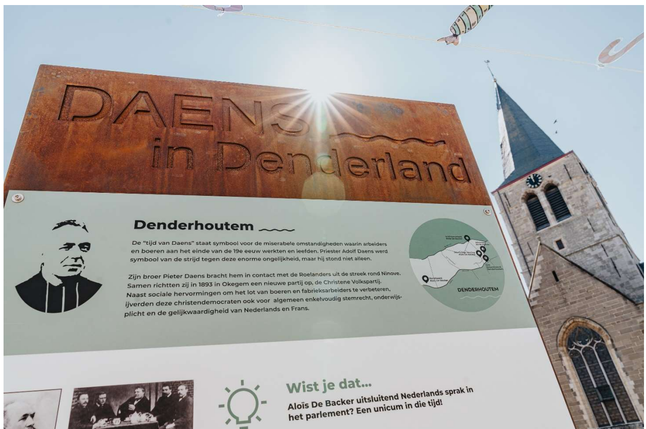
Erfgoedbord Daens in Denderland – Denderhoutem.

Daarnaast werden twee geleide fietstochten georganiseerd, om de verschillende erfgoedborden te verbinden. Één tocht trok van Denderleeuw richting Aalst, een andere trok rond Ninove.