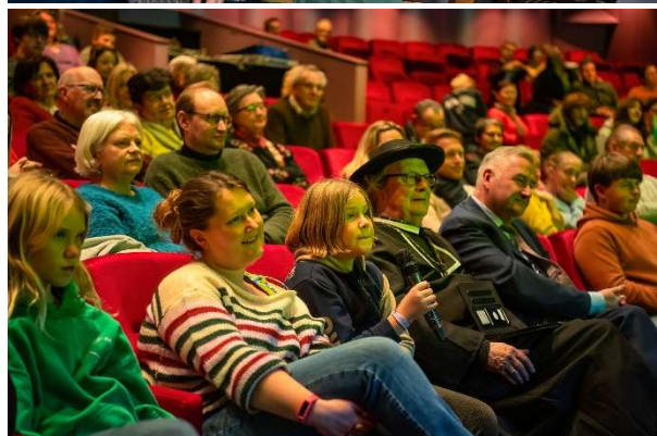
Daensdag – 15/01/2023.